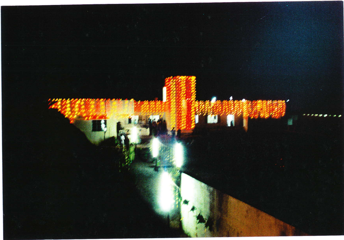
Maiyanur kindertehuis bij nacht, na de opening