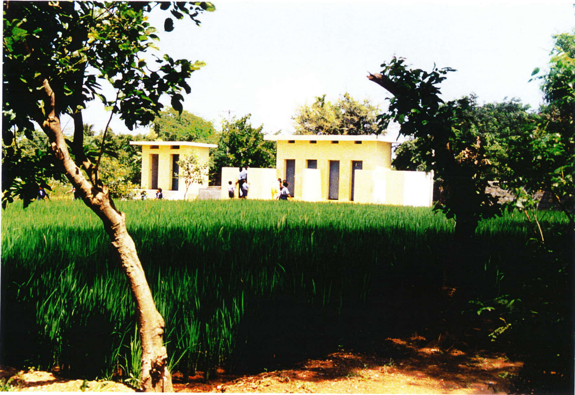
foto 3. De toiletgebouwtjes. De rechter is vergroot, de linker is nieuw.