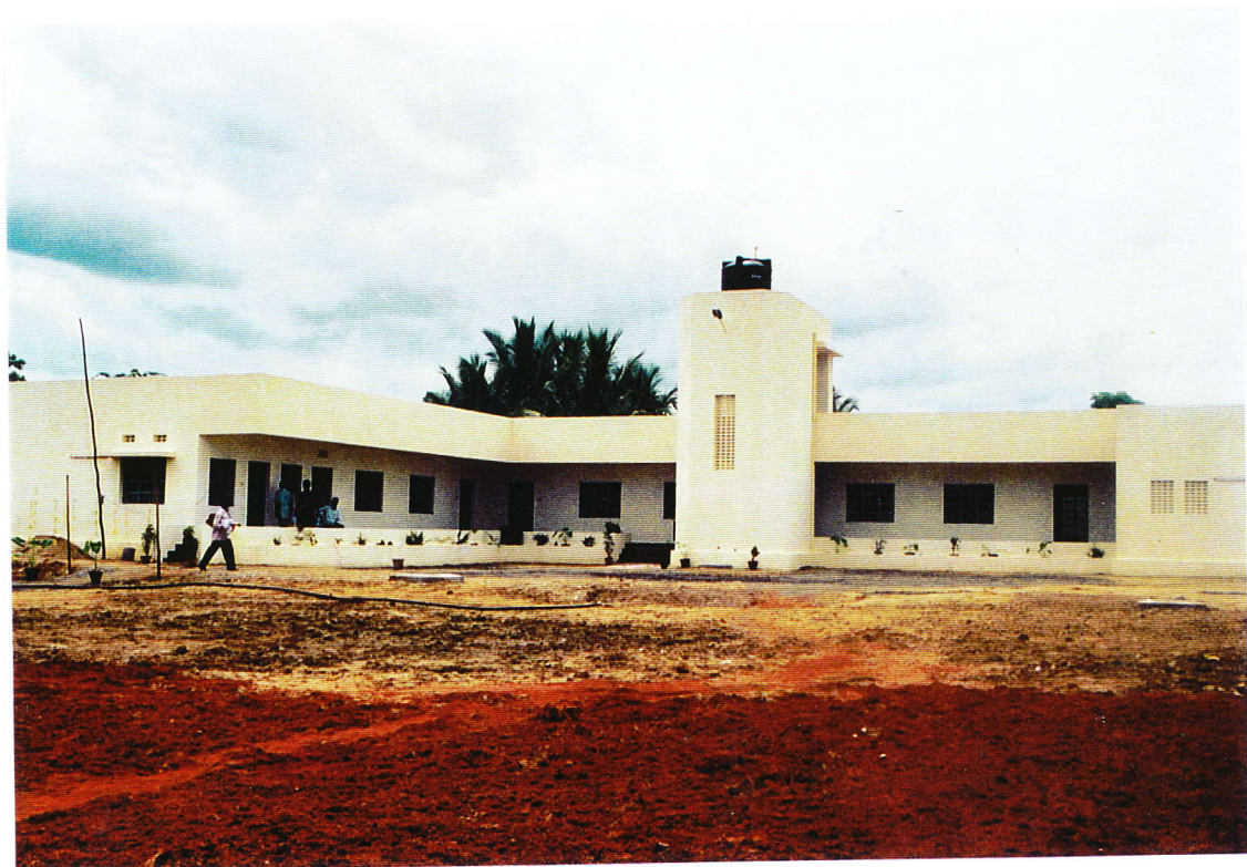
foto 6. Maiyanur kindertehuis - Voorzijde.