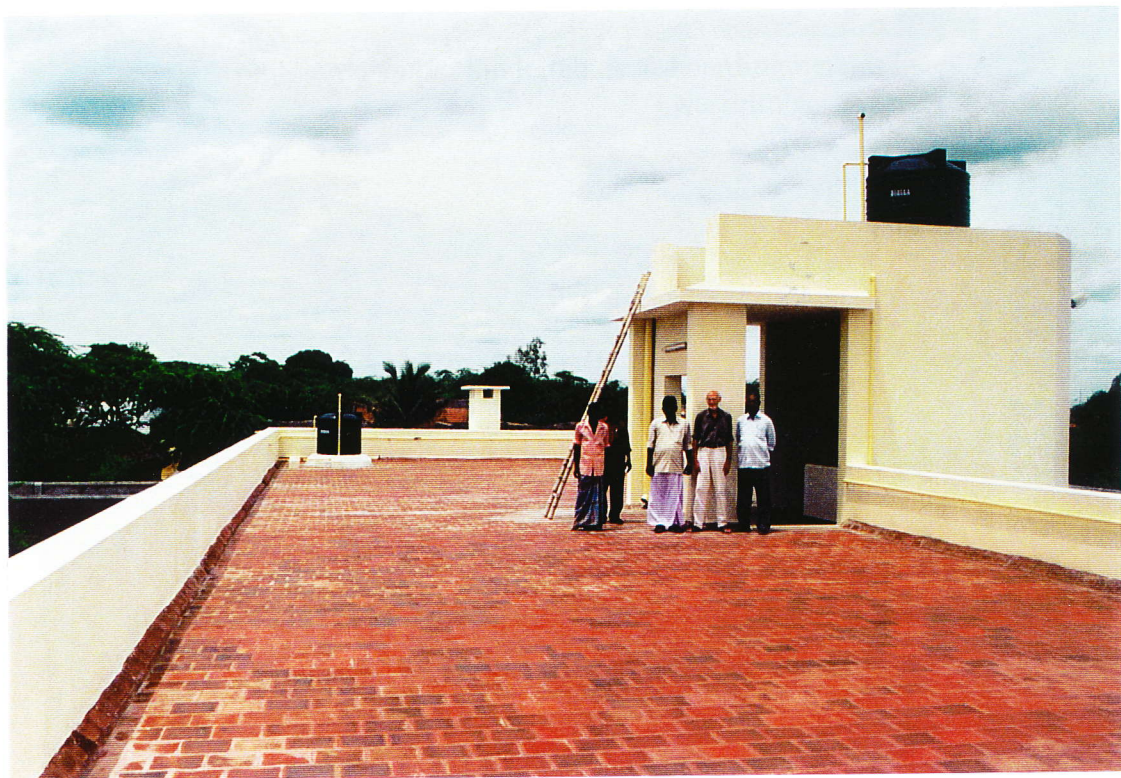
foto 8. Maiyanur kindertehuis - Het dakterras met vlnr; aannemer, architect en opzichter.