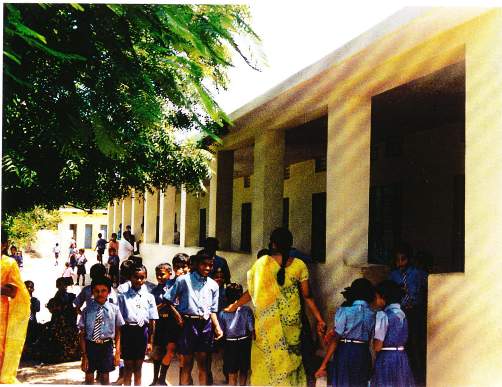
foto 4. Het gerenoveerde schoolgebouw. De veranda is aangebouwd.