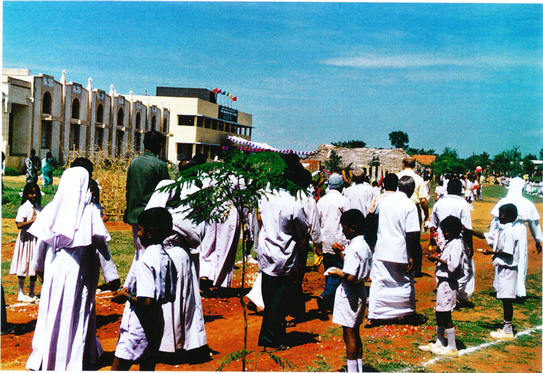
foto 11. Budalur schoolgebouw - Op weg naar de opening.