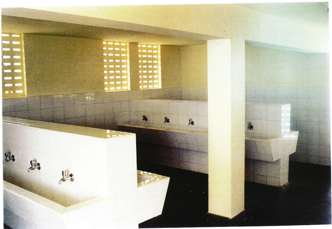
foto 10. Maiyanur kindertehuis - wasruimte