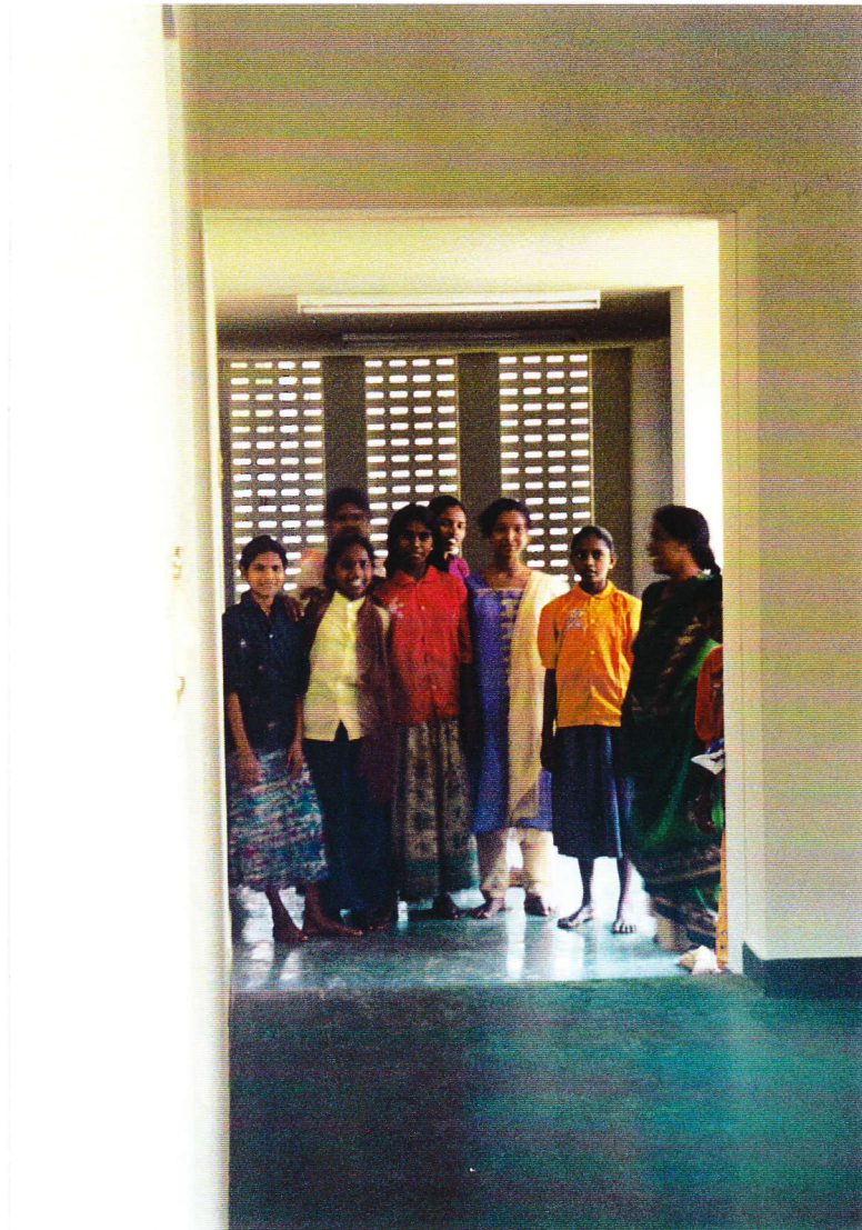
foto 9 Maiyanur kindertehuis - boardingmeisjes in wasruimte.