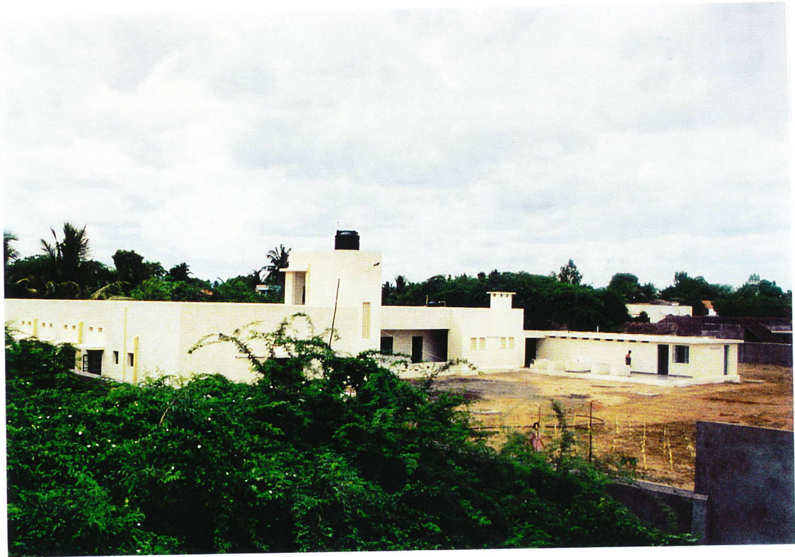
foto 7. Maiyanur kindertehuis - Overzicht met uiterst rechts de bezoekersruimte