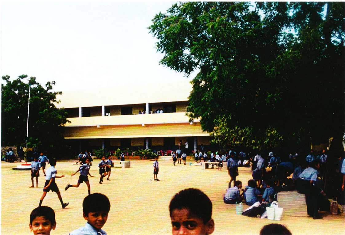
foto 2. Damaracherala - Het schoolgebouw met verdieping