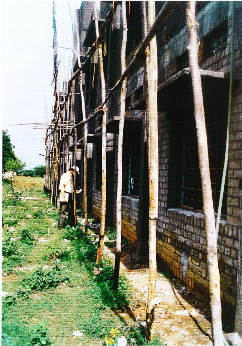
foto 13. Budalur schoolgebouw - Achtergevel.