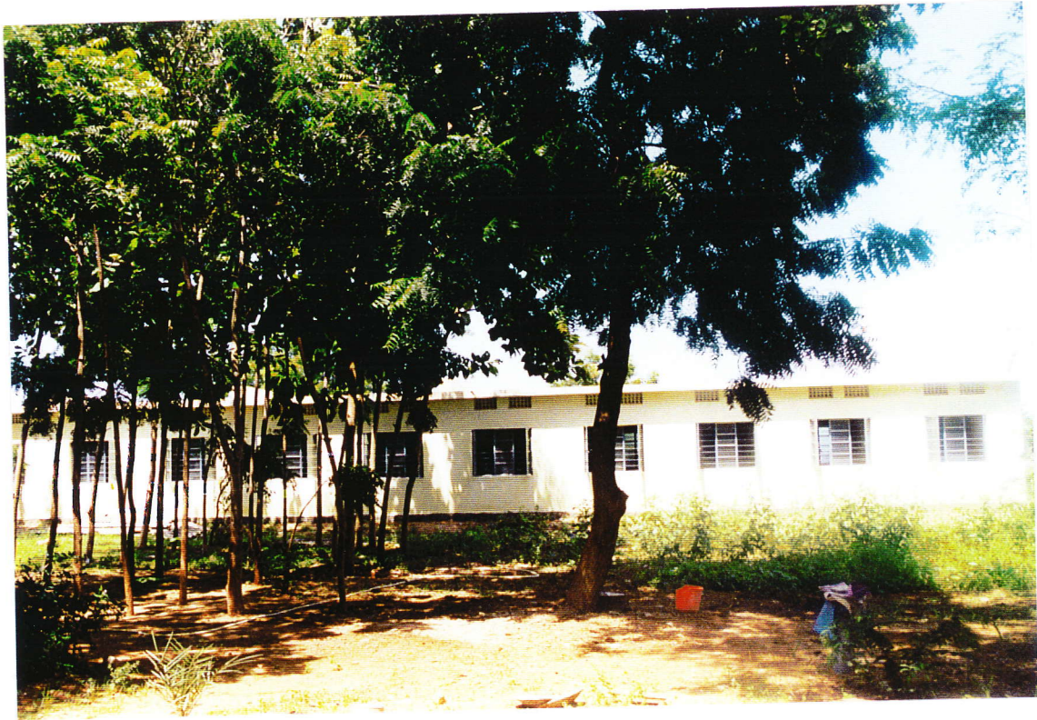
foto 5. Het gerenoveerde schoolgebouw - Achtergevel.