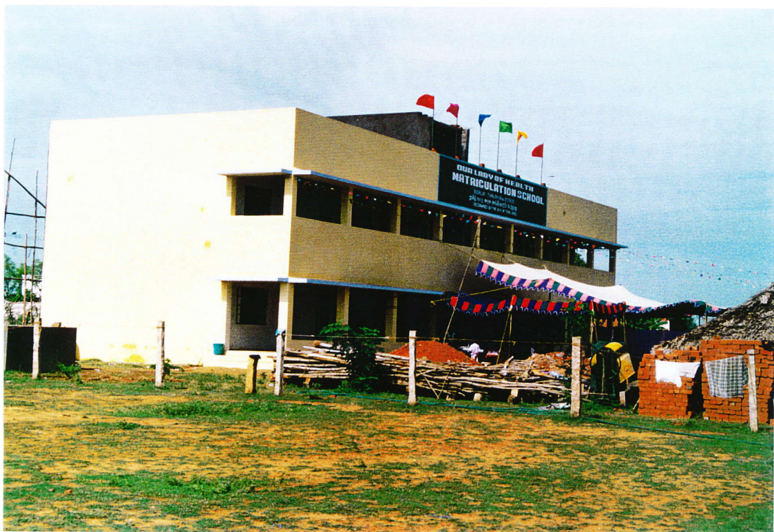
foto 12. Budalur schoolgebouw - Voor- en zijgevel