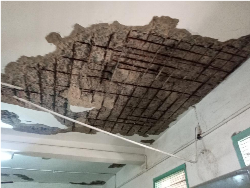
Juli 2021: werk aan dak, muren en vloeren