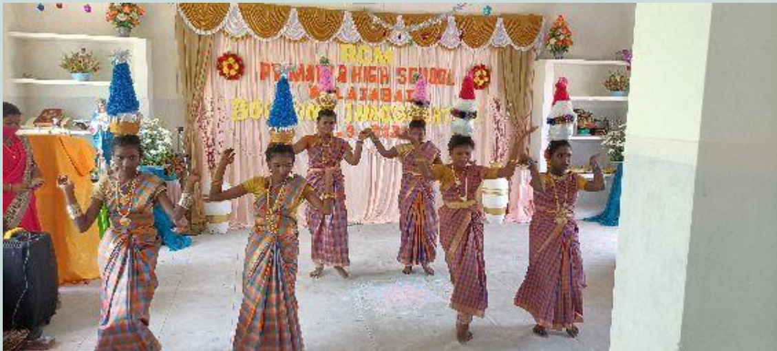
Dans bij de opening van de nieuwbouw en renovatie in Walajabad

https://thomasbouwprojecten.nl/projecten/project-voorbereiding-walajabad-nieuw/ .