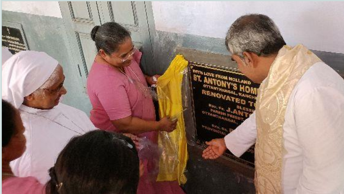
Ottanthangal op 11 september