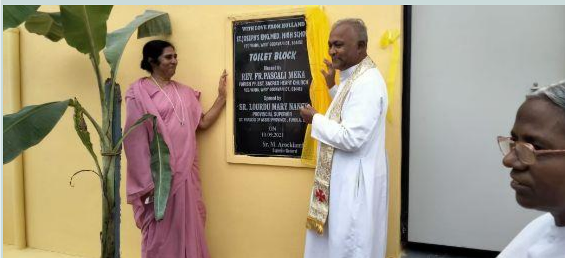
Vegiwada op 10 september