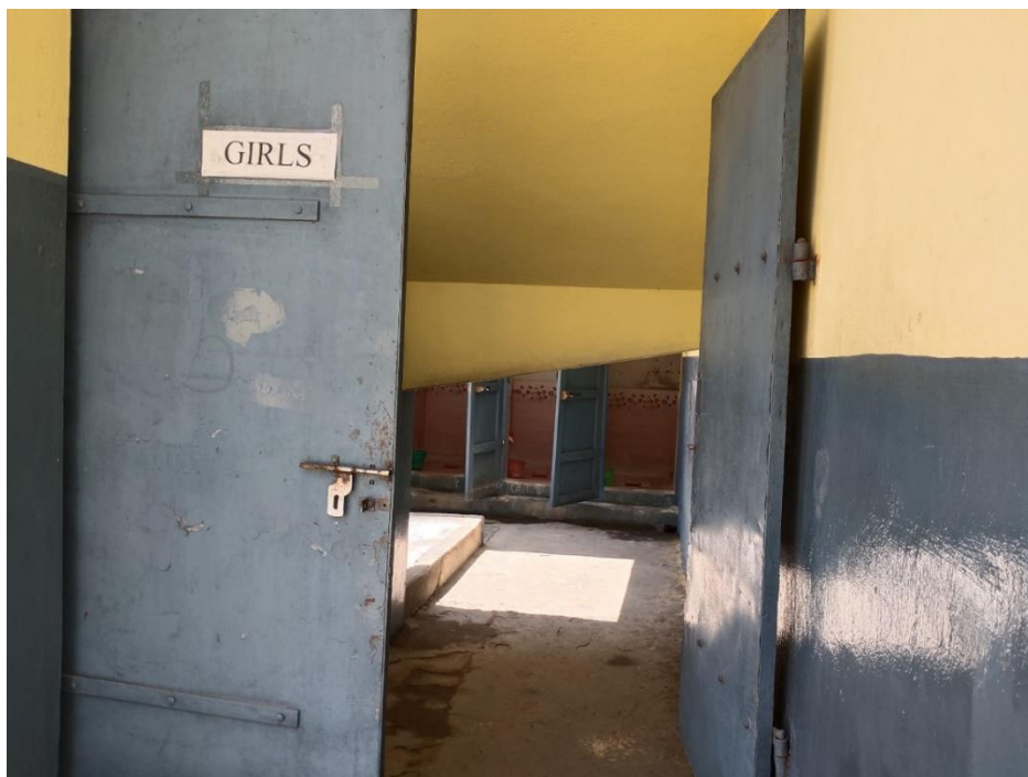
Huidig toiletgebouw voor meisjes