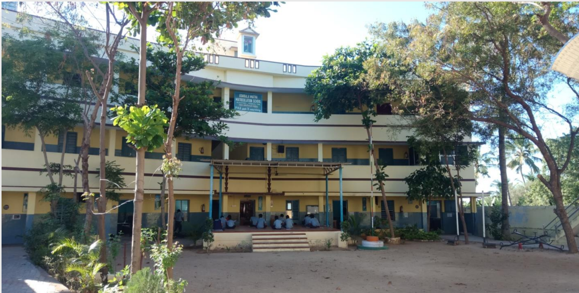
Voorraanzicht van de school