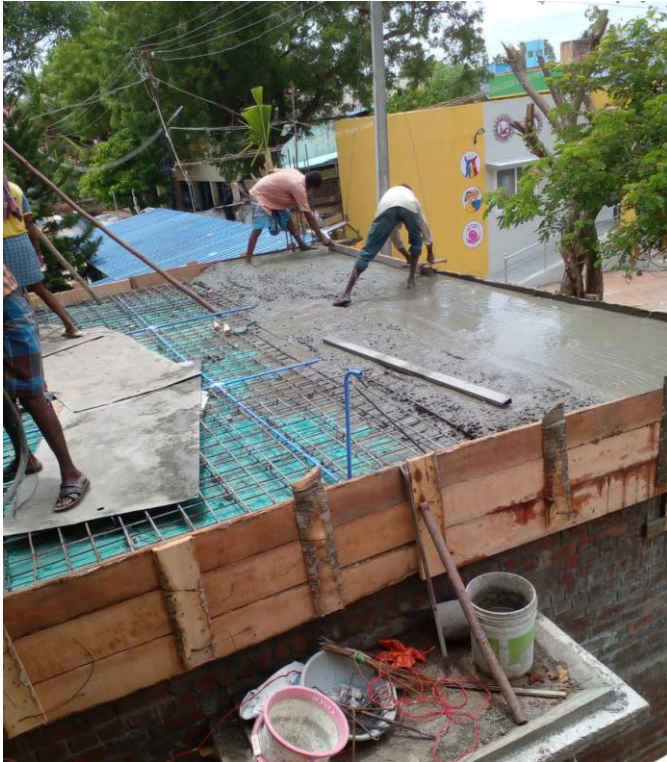
Storten van het dak van het toiletgebouw