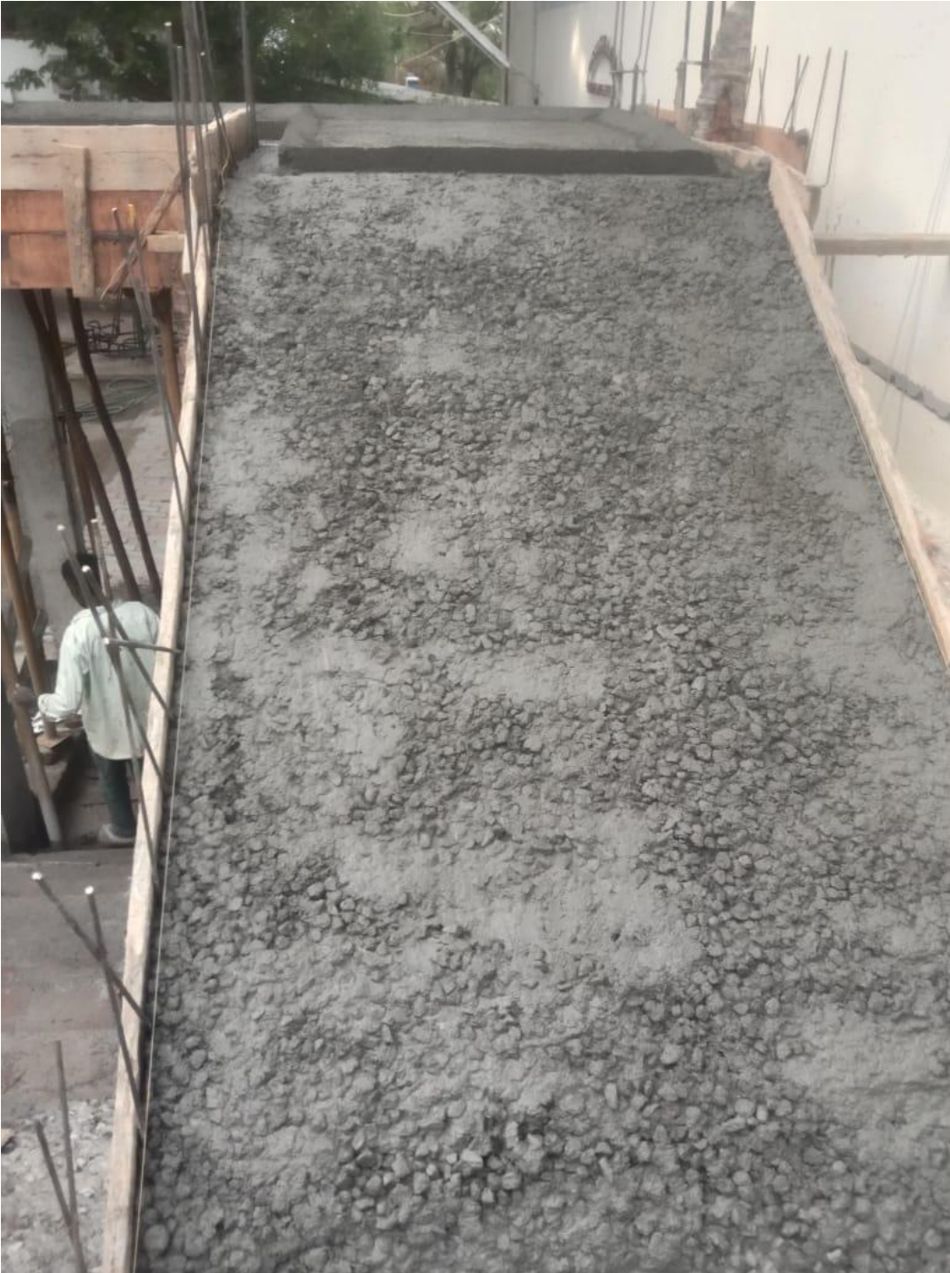
Storten van de trap