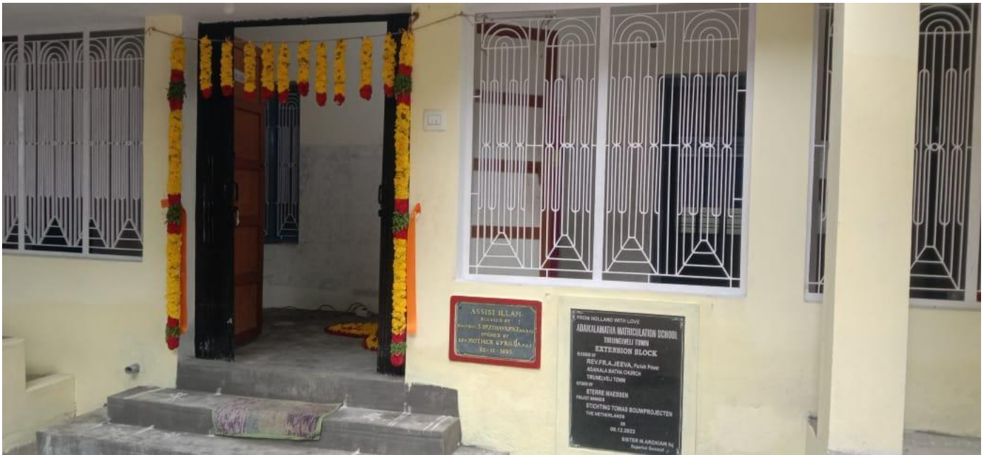
Uitbreiding school, ingang