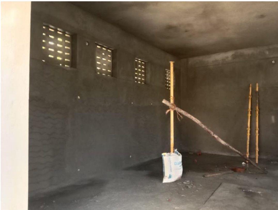
Toiletgebouw buitenkant gereed. Binnenkant ruwbouw.