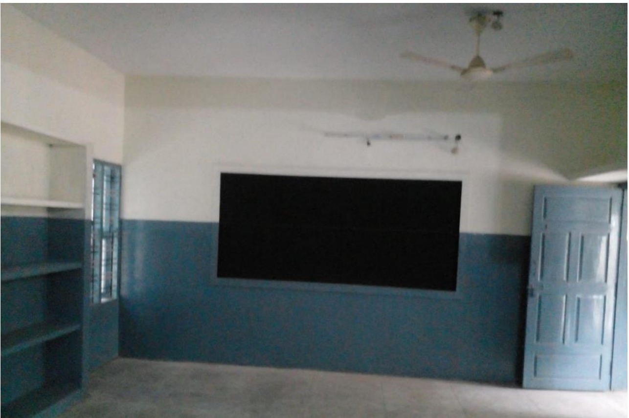
Klaslokaal, bijna gereed