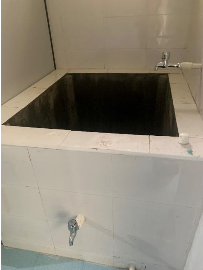
Toiletgebouw dak, wasbak