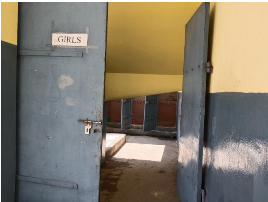
Huidig toiletgebouw voor meisjes