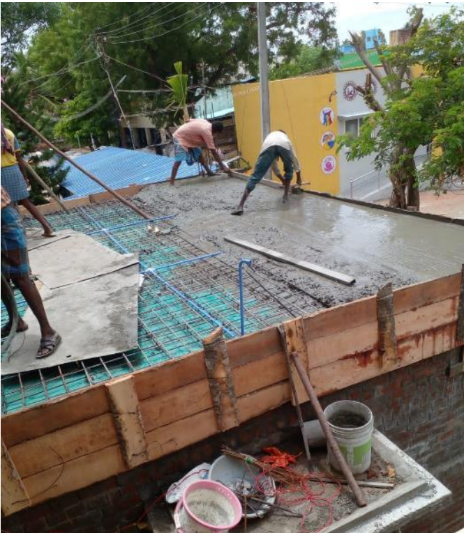
Storten van het dak van het toiletgebouw