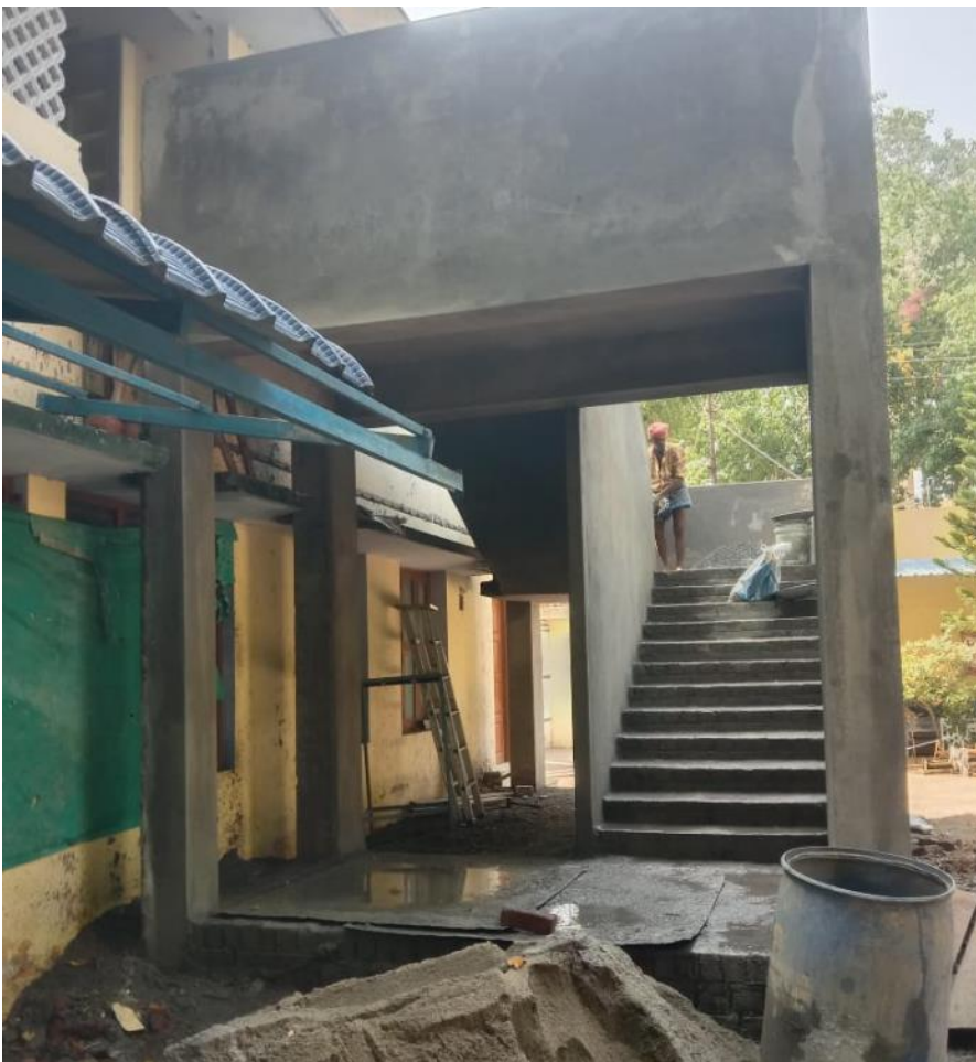
De trap aan de buitenkant van het gebouw voor de drie lokalen