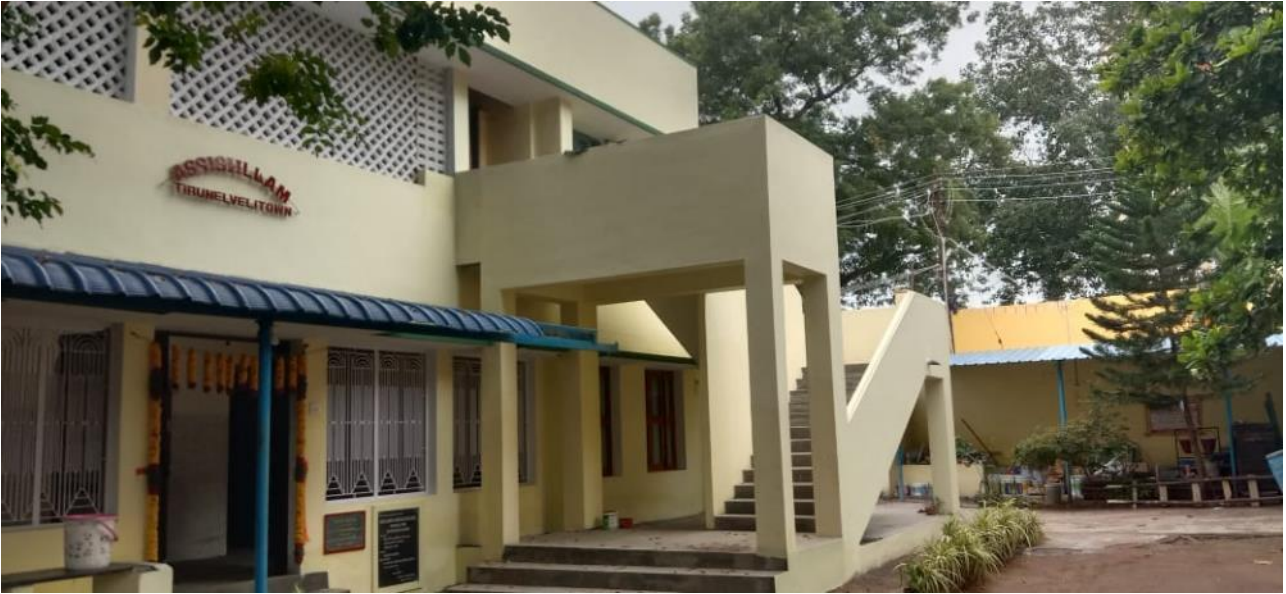
Uitbreiding school, buitenkant en trap