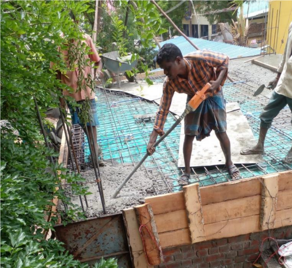
Storten en glad maken van het dak van het toiletgebouw