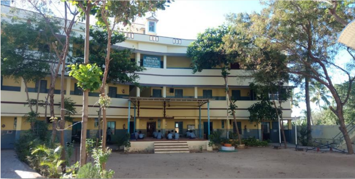
Voorraanzicht van de school