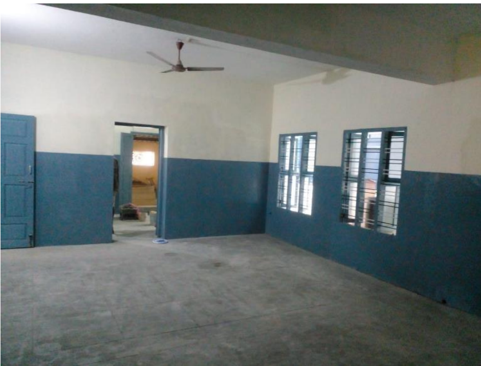
Klaslokalen, bijna gereed