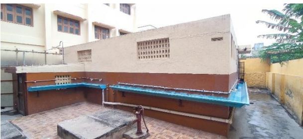
Het oude (nu gesloopte) gebouw