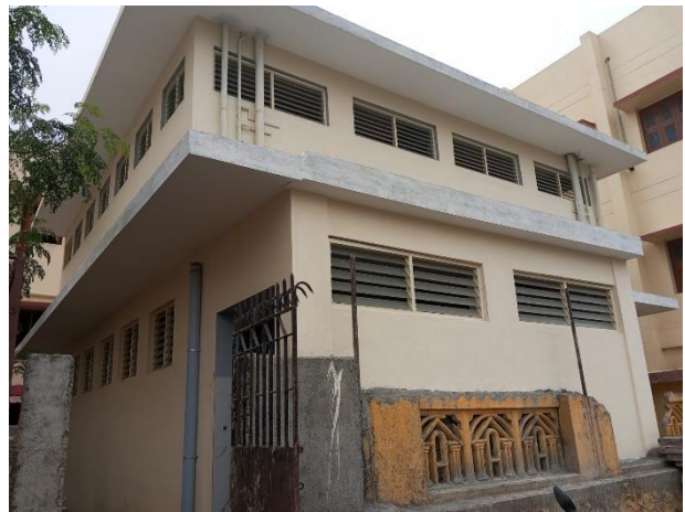
Het nieuwe gebouw