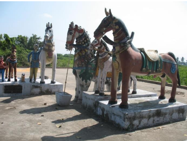
Foto 3103. Pongal festival. Paarden voor de tempel

voet naar een tempeltje in de buurt. Een priester treft de voorbereidingen en uiteindelijk wordt er een geit en een kip geofferd, een tafereel, dat ik liever niet aanschouw. Voor de tempel staan paarden, de rijdieren van de god, zoals vele goden hun eigen rijdier hebben.