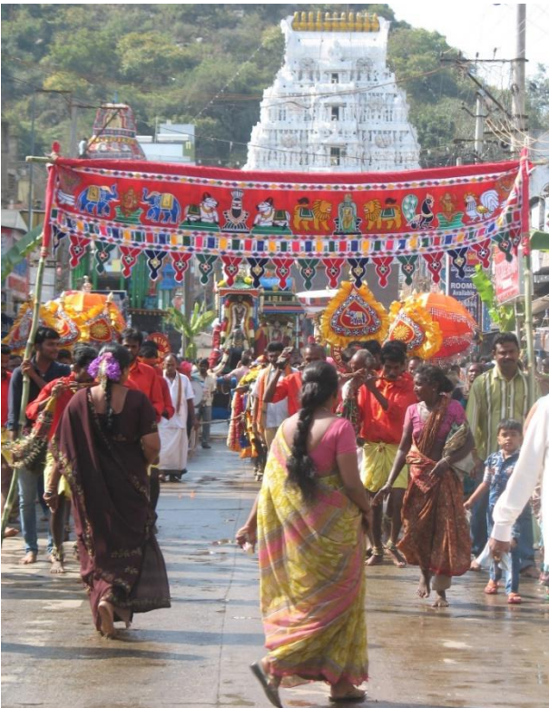
Foto 3493. Sri Kalahasti. Optocht