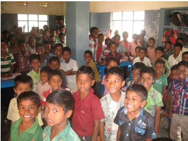
Foto 3160. Thiruvallur. Jongens in de studiezaal

Na een nachtje slapen gaat het weer verder naar Thiruvallur , waar de elektrische installatie is verbeterd. En dat moet gezegd.....dat ziet er goed uit.