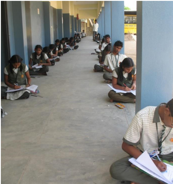
Foto 3464 Damaracherla . Examen op de veranda

Het kindertehuis, dat voor een deel gebruikt werd als school, is nu volledig beschikbaar als kindertehuis. Er zijn nu 72 jongens en 23 meisjes en de intentie is meer arme meisjes op te nemen, mede omdat de ruimte van de jongens geen toename mogelijk maakt. Dichtbij stroomt de Krishna rivier, een heilige rivier voor de Hindoes. Een leuke plaats voor de kinderen om te bezoeken, ook omdat op dat punt een zijrivier in de Krishna rivier uitkomt. Op het voorblad is hiervan een foto geplaatst.