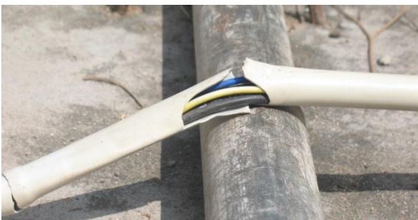
Foto 3164. Elektrabuis