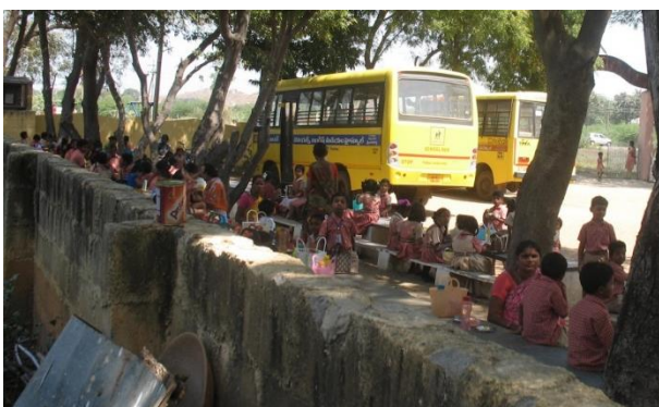
Foto 3512. Sri Kalahasti Lunchpauze

Uiteraard kan ik niets beloven, maar met de zusters bekijken we al wel de plaats, waar het schoolgebouw zou kunnen komen. Dat blijkt na inmeting de plaats te zijn, waar 's middags de kinderen de lunch gebruiken. Dan zullen de bomen moeten wijken en de lunch ergens anders moeten plaatsvinden.