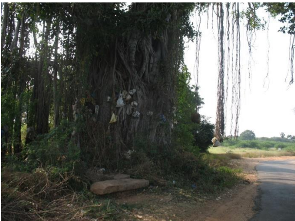
Foto 3125 bomen met luchtwortels

We hebben ook de drie geselecteerde aannemers uitgenodigd te komen om de situatie te kennen. Het blijkt dat één aannemer al tekeningen heeft gemaakt, wat z'n goede en kwade kant heeft. Goed is het tijdig te zien dat onze tekeningen niet bruikbaar zijn omdat voor een college