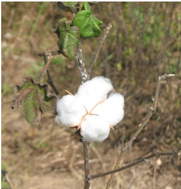
Foto 3101 katoenplant

heeft. Enorme velden met witte plujsjes, maar ook veel chili, dat als het te drogen ligt als een dieprood tapijt de velden siert.