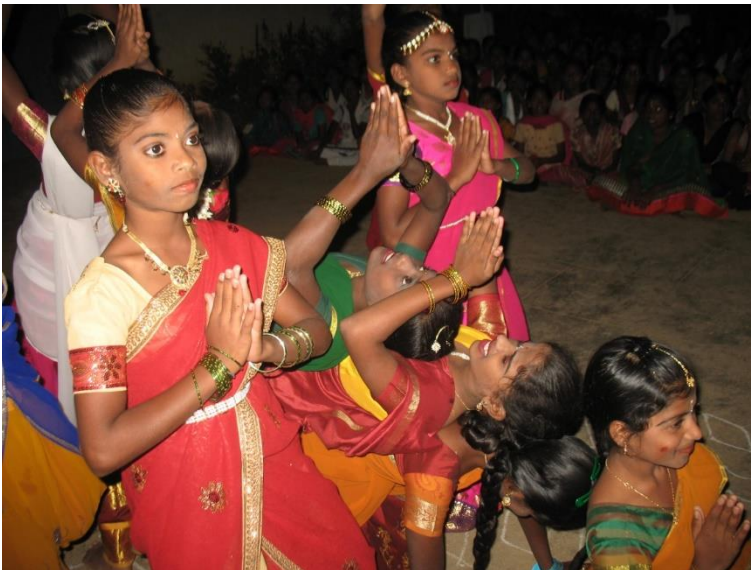
Foto 3193. Jolarpet. Slotscene van de dans