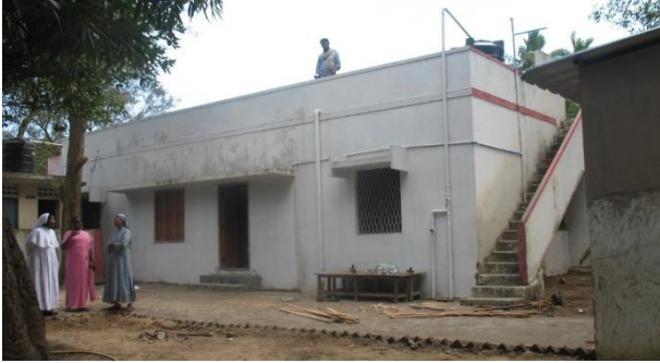
Foto 3156. Pillavandanthai. Opknappen boarding

Er is nog zo'n 9.000 Euro nodig voor de electra, loodgieters – en schilderwerk, toiletdeuren en meubilair. De kinderen in de leeftijd van 4 – 10 jaar verblijven tijdelijk in het nu overvolle huis van de zusters. Over het algemeen kinderen die rondzwerven in de omliggende dorpen, die over het algemeen geen vader meer hebben, althans een vader die gewoon is vertrokken, waarbij