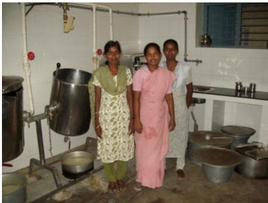
Perambalur gerenoveerde keuken