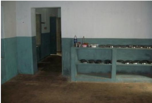
Cheyar opening in tussenmuur

Men heeft niet het ontwerp aangehouden om een opening van 2 meter breed in een tussenmuur te maken, maar heeft deze 1 meter breed gemaakt. Gelukkig is men