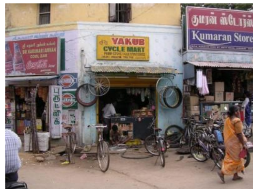
Straatbeeld in Chennai