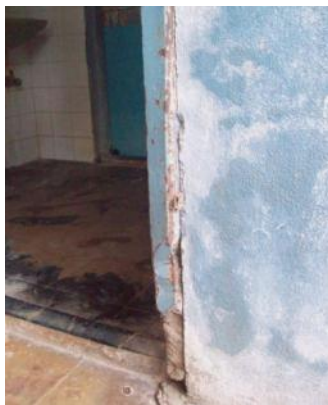
PT Parru deur toiletgebouw

het dak blijkt het lekkageprobleem verholpen te zijn door het uitvoeren van de vorig jaar voorgestelde verbetering van het afschot naar de regenwaterafvoer. Het vervangen van een zwaar verroest raam in de dakopbouw door een betonnen