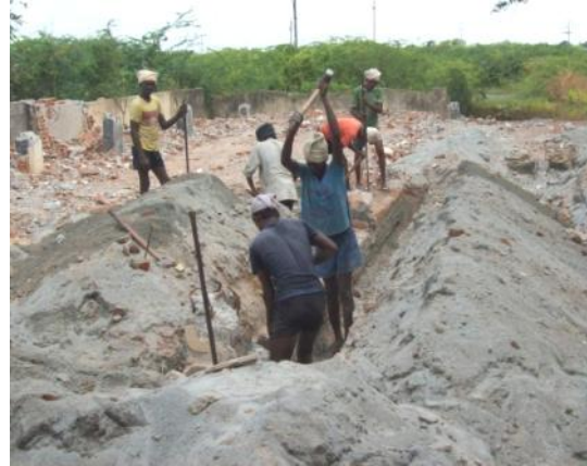
Sri Kalahastrri bouwvakkers

uur weer terug in het Generalate. De volgende