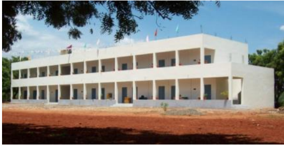
Singampunari nieuwe school

Dit is nu blijkbaar voldoende betrouwbaar om ook door ons toegepast te worden. Na de lunch vertrekken we naar Singampunari waar om 16:00 uur de inzegening van de school en daarna het feestprogramma zal beginnen. Om 15:00 uur komen we aan en hebben tijd om