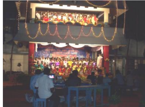
School in Singampunari opgeleverd

“BOUWEN VOOR KINDEREN IS BOUWEN AAN DE TOEKOMST”