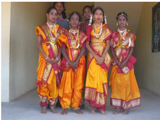
gereed voor de dans

De volgende halte, al weer wat meer naar het noorden, is Budalur , waar een oude school moet worden opgeknapt en twee klaslokalen moeten worden bijgebouwd. Bovendien moet er een scheidingsmuur worden gemaakt omdat omwonenden steeds op het terrein komen. Eerst natuurlijk weer een ontvangst waarbij in allerlei stijlen wordt gedanst.