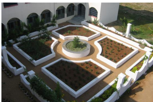
nieuw aangelegde tuin van het hostel

Met de trein, nu met de luxe vanaf het perron in te kunnen stappen, terug naar Chennai. Daar brengen we de nacht door en gaan de volgende dag met de auto naar Vandavasi , de grootste vestiging van de zusters. Op de school van de zusters zitten 1100 meisjes en in de internaten 410. De voortgezette opleiding, waarvoor onze stichting een hostel heeft gebouwd, heeft inmiddels meer dan 150 studenten. Zij krijgen een computeropleiding, opleiding tot naai-onderwijzeres en onderwijzeres voor de eerste vijf schoolklassen. Goede opleidingen, die de meisjes een kans op zelfstandigheid bieden als ze daarna een baan gaan zoeken. Iets, waar zowel de zusters als wijzelf meer aandacht aan willen besteden omdat jonge vrouwen daarmee onafhankelijk kunnen zijn. De school is inmiddels te klein en de zusters zouden graag een nieuw gebouw hebben, waar dan de opleiding tot naai-onderwijzeres gevestigd kan worden. Overigens speelt het probleem dat de arme meisjes hiervoor geen geld hebben, iets waar de Jongerenstichting zich ook op wil gaan richten.