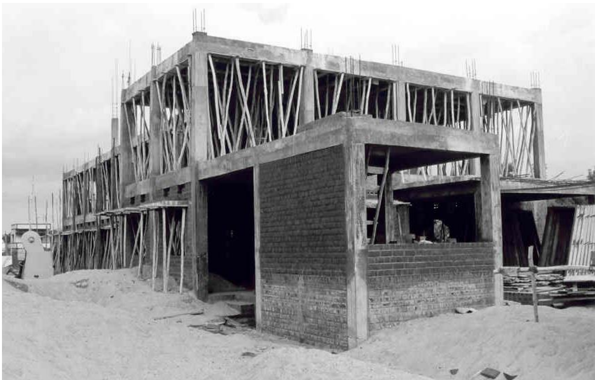
Boarding Perumalpalayam in aanbouw