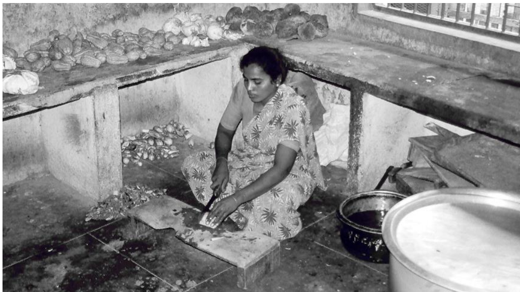
Keuken Vandavasi voor de verbouwing.