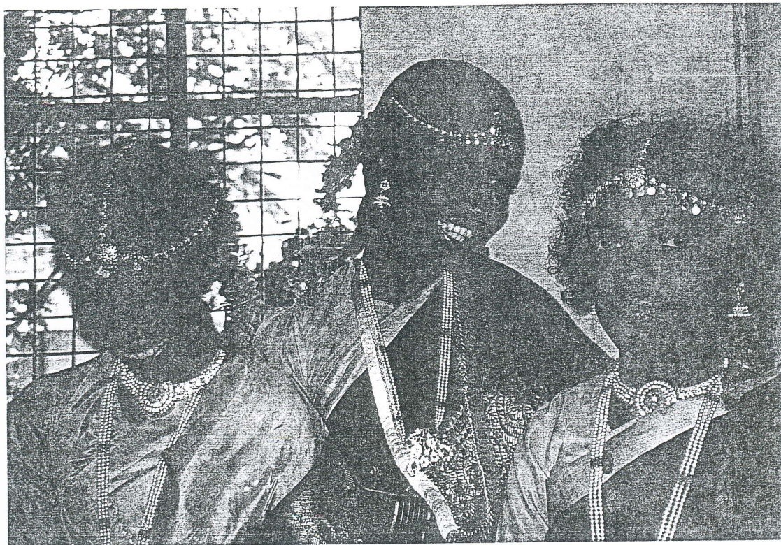
Indian beauties, Ennore