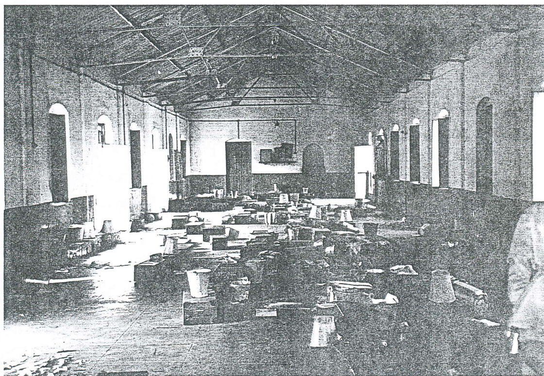
Vandavasi, toekomstige studiezaal (na renovatie).