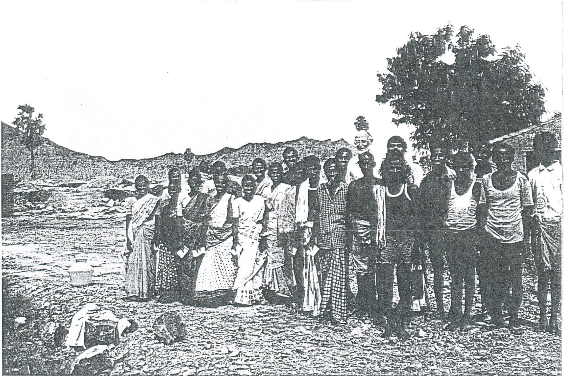
. Elambalur, de bouwvakkers.