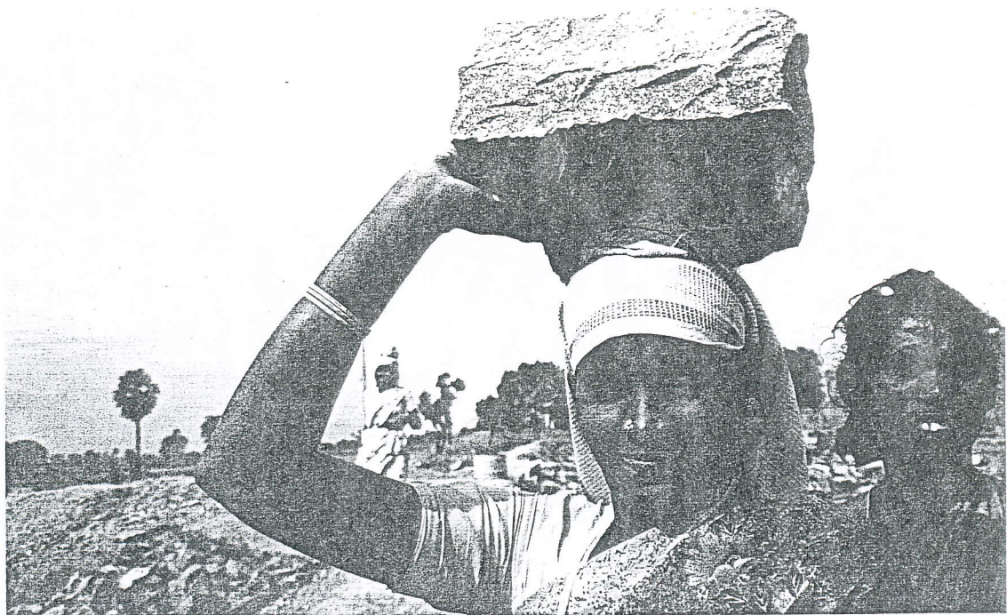
Elambalur, vrouwen "opperen" de granietblokken.