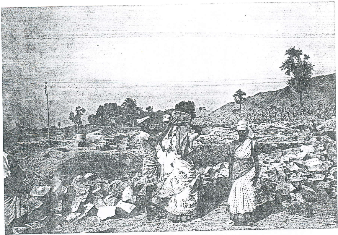
Elambalur, aanleg fundatie.